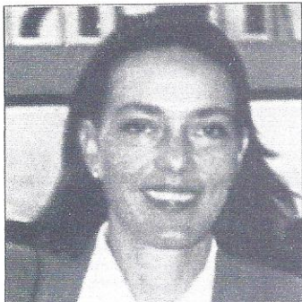
ΤΗΣ ΜΙΡΑΝΤΑΣ ΞΑΦΑ

Η άποψη του να αφήσουμε τα ευρωπαϊκά νομίσματα ελεύθερα να ανταγωνιστούν είναι πολύ κοντά στην κατάσταση που ήδη επικρατεί σήμερα: τα νομίσματα χάνουν αξία όταν οι κυβερνήσεις δημιουργούν πληθωρισμό στην προσπάθειά τους να διαφύγουν από δημοσιονομικές δυσκολίες και με την εξάλειψη των συναλλαγματικών ελέγχων, ιδιότητες και επιχειρήσεις μεταφέρουν τις αποταμιεύσεις τους -άν όχι το σύνολο των συναλλαγών τους- σε σταθερότερα νομίσματα. Ένας από τους στόχους της Νομισματικής Ένωσης είναι η μείωση του κόστους συναλλαγών, το οποίο προέρχεται από την ύπαρξη πολλών νομισμάτων στα πλαίσια της ενιαίας ευρωπαϊκής αγοράς. Η πρόταση του συγγραφέα θα οδηγούσε σε περαιτέρω αύξηση του κόστους συναλλαγών.